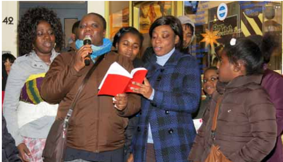
Afrikanische Frauen sangen beim Adventsfenster in der Hansmannstraße (siehe Bericht Seite 6)

Informationen erteilt Marcel van Westen unter Tel. 02408 - 9509971 oder E-Mail m.vanwesten@apollonia-barbara-severin.de