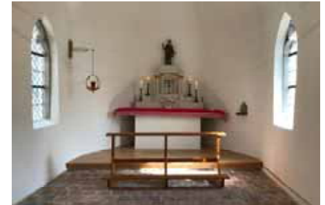
Tag des offenen Denkmals Foto: Helmut Harth 2017

Nachdem die Arbeiten im Innenraum der Kapelle nun auch weitgehend abgeschlossen sind, konnten wir beim „Tag des offenen Denkmals“ und Gemeindefest St. Apollonia, den Altar nach langer Zeit noch einmal so herrichten, wie er immer zum Namenstag der Pfarrpatronin, der heiligen Apollonia am 9. Februar, geschmückt wurde. Bei den drei Führungen zur Apollonia-Kapelle, die wir am 10. September angeboten haben, konnten sich die rund 80 Besucher selbst ein Bild der Apollonia-Kapelle machen. Die nächste Aufgabe ist der Altaraufsatz!